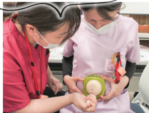
糖尿病・インスリン研修