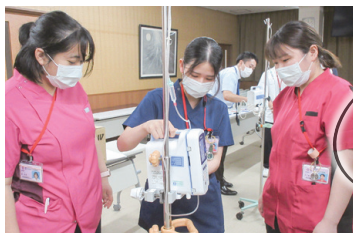
輸液ポンプ・シリンジポンプ研修