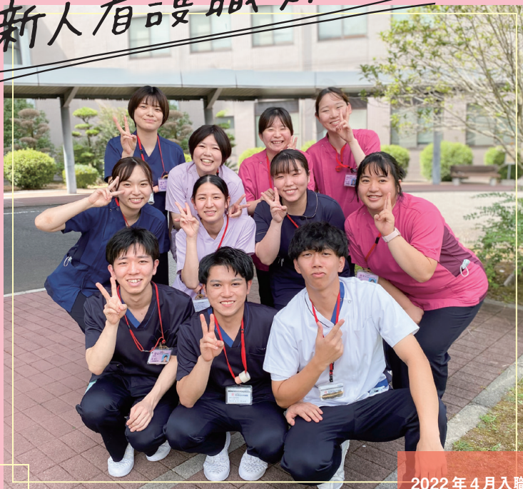
2022年4月入職 新人看護 職員11名

新人看護職員は、入職後1年間の教育研修を受けます。これは、基本的な臨床実践能力を習得するための研修として、2010年厚生労働省から努力義務化されました。当院でもガイドラインに基づき、新人集合教育やグループワーク、入院体験学習等、多方面での研修を行っています。しかし2020年以降は、コロナ禍により看護学生の授業は対面からオンライン主体へ、また病院実習も十分でない状況が発生するなど、様々な制限を受けました。そこで入職してくる新人看護職員の不安を少しでも軽減し、1人ひとりがいきいきと働ける環境づくりを目指して、研修内容とスケジュールの再構築を行いました。今年度は、まず入職時の部署配属を行わず、4月の1ヶ月間は教育担当師長が担任となり、新人看護職員同士の交流を深めることに重点を置きました。次に各部署へのフレッシュ研修(体験)で現場を知った後、5月から希望部署に配属しました。その後もメンタルサポートとして、7月・11月・2月に教育担当師長が面談を行っています。今回は、このような逆境を乗り越え、毎日笑顔で頑張っている新人看護職員11名の奮闘ぶりをご紹介します。