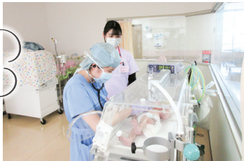
産婦人科病棟でのフレッシュ研修