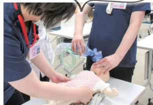
小児救急看護研修