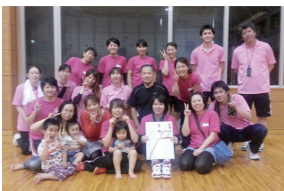
学生時代はバレーボール部に所属。産婦人科は院内のバレーボール大会でも優勝常連チーム。

卵巣がんの早期発見の為には、前述した通り、まず卵巣腫瘍の診断が必要です。月経のある方はホルモンの影響により、腫瘍を認めなくても卵巣が腫れていることがあり、判断は困難で、複数回の確認が必要となる場合もあります。当院では、人間ドックや婦人科受診で卵巣腫瘍の有無を確認し、精密検査後に治療、もしくは定期検診を行っています。定期検診の必要性は、卵巣腫瘍のがん化の問題があります。良性腫瘍で経過を見ていた方が、突然、がん化して手術される方もいらっしゃいます。卵巣がかなり腫れてきても、少し太ったぐらいにしか思わず、気づかず放置される方が多いです。皆さまもご心配な時は、人間ドック、産婦人科受診等をお勧め致します。