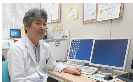
心がけているのは女性のライフステージと、患者さんの気持ちに配慮すること。