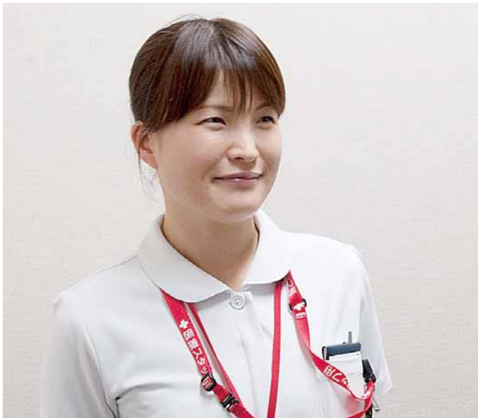
緩和ケア 認定看護師